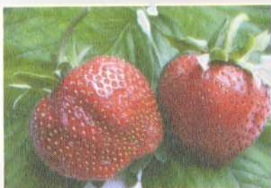
FRAISES LES VARIÉTÉS OUBLIÉES