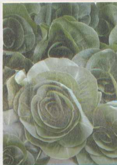
CHICORÉES VIVE LA DIVERSITÉ