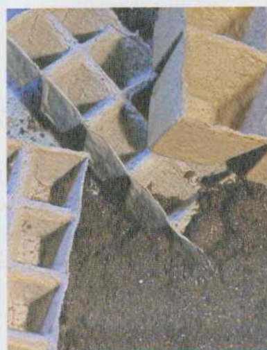
AU BANC D'ESSAI LES CONTENANTS